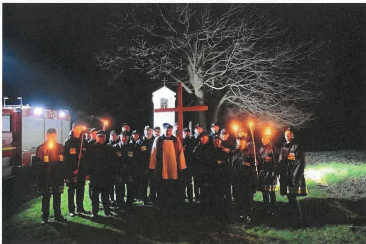
Lokalne inicjatywy – parafialna droga krzyżowa pod symboliczną kapliczkę przy lesie