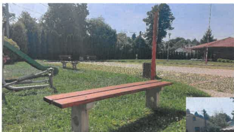
Teren rekreacyjny przy Domu Kultury