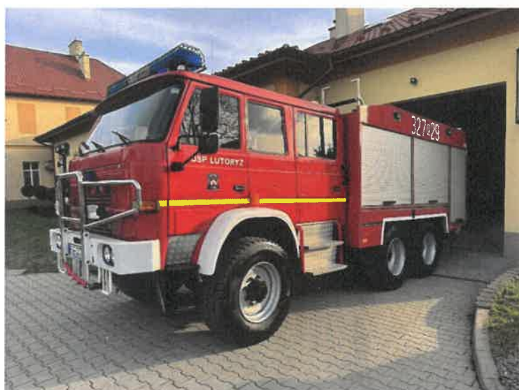
Sily i Środki Ochotniczej Straży Pożarnej w Lutoryżu