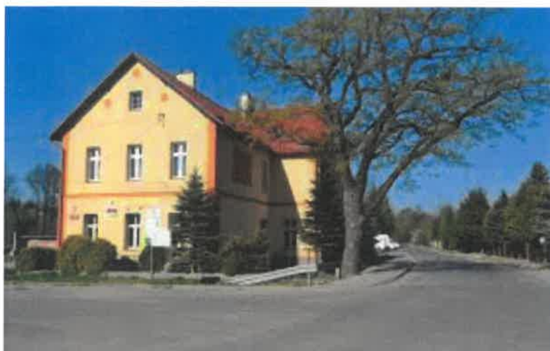
Budynek Domu Kultury oraz Remizy Strażackiej