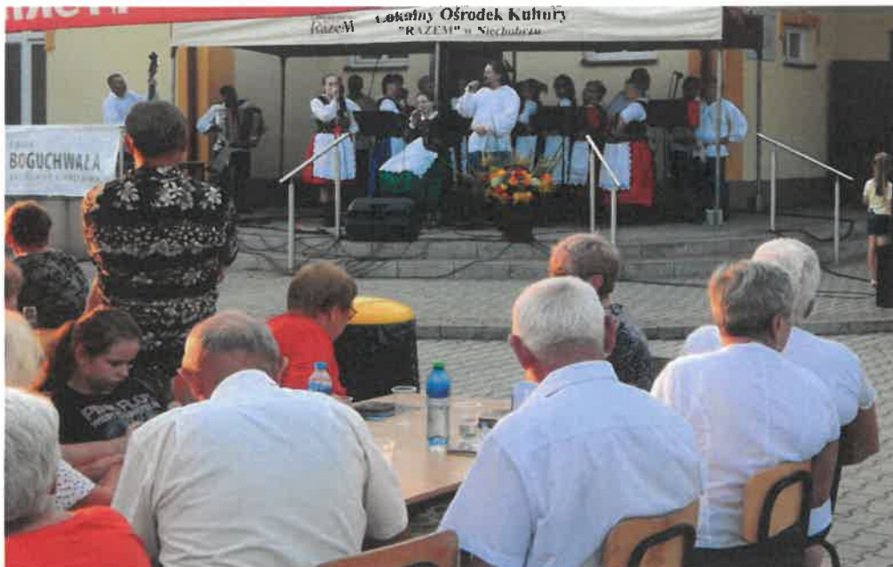
Integracja społeczna: Piknik rodzinny na zakończenie wakacji na terenie przy Domu Kultury połączony z występami lokalnych zespołów oraz pokazami strażackimi