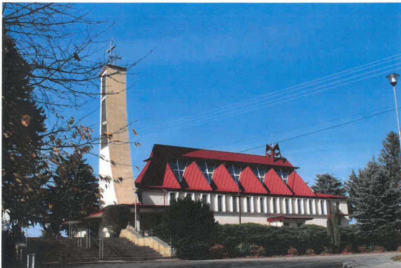
Kościół Parafialny pw MB Częstochowskiej i św. Józefa