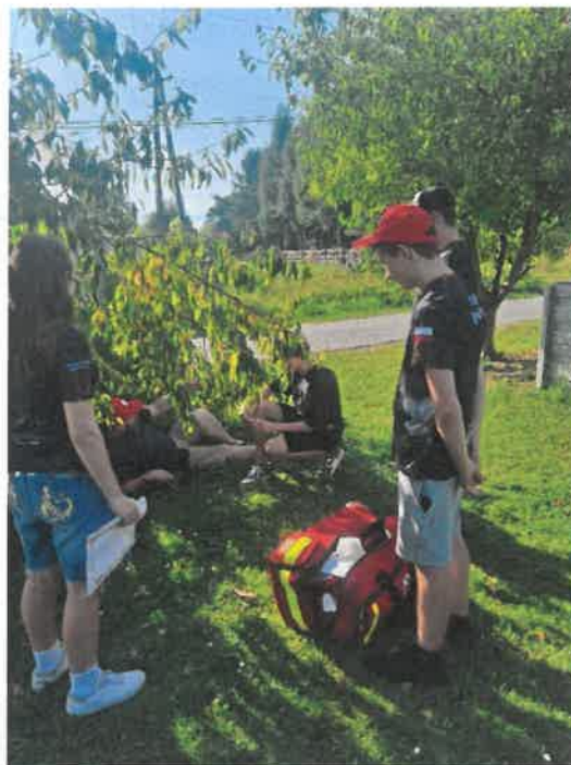
Zajęcia i inicjatywy prowadzone przez Młodzieżową Drużynę Pożarniczą oraz Koło Gospodyń Wiejskich